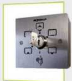
Selector a llave 8 posiciones 80 mm