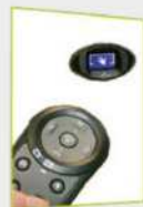
Visioblu y Telecomando 5