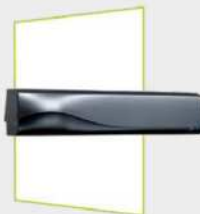
Radar hiperfrecuencia y seguridad Infrarrojo activa