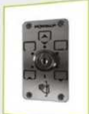
Selector a llave 4 posiciones 40 mm