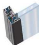
Bastidor RPT G50